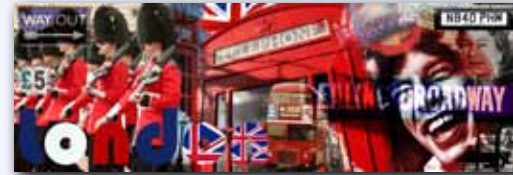
GAMME MARKET premier prix

ENCRE PIGMENTAIRE ÉCOLOGIQUE. STABILITÉ ET DURABILITÉ DES COULEURS.